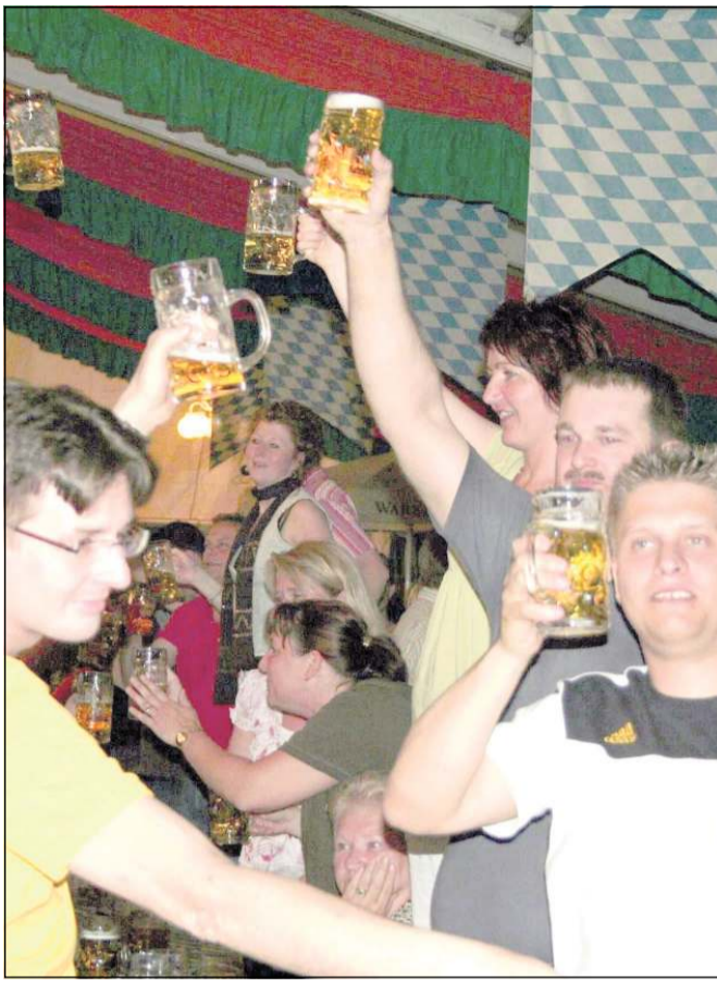
Zum letzten Mal fand in diesem Jahr das Bayernfest statt - es hatte Kultstatus.

Bis vor wenigen Tagen zählte Erwitte westlichster Ortsteil noch exakt 316 Einwohner. Inzwischen gab es jedoch Zuwachs: Der 317. Einwohner erblickte das Licht der Welt. Weit über die Orts- und Stadtgrenzen hinaus war Schallern bislang nicht zuletzt wegen seines Bayernfestes bekannt. In diesem Jahr feierte der Schützenverein als Organisator sogar die Jubiläumsauflage. Seit wenigen Tagen steht jedoch fest: Das Bayernfest wird künftig nicht mehr gefeiert (wir berichten). Zu hoch sind inzwischen die Kosten bei zugleich gesunkenen Besucherzahlen. Das Fest bleibt aber eine Kulturveranstaltung, an die sich nicht nur Schallerner erinnern. ■ bw